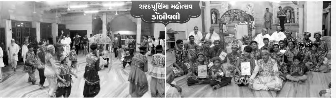
શરદપૂર્ણિમા મહોત્સવ ડોંબીવલી

ગઢપુર પ્રદેશના મહુવા શહેરને આંગણે પ.પૂ. આચાર્ય મહારાજશ્રીના આશીર્વાદથી ઉજવાયેલ શરદપૂર્ણિમા મહોત્સવ