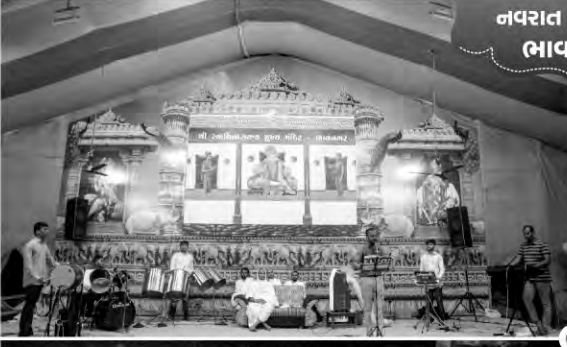
નવરાત રાસોત્સવ ભાવનગર