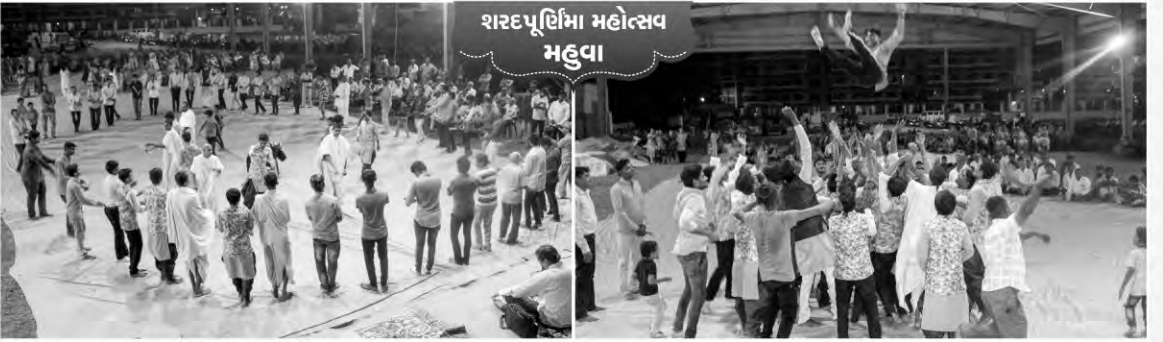
શરદપૂર્ણિમા મહોત્સવ મહુવા