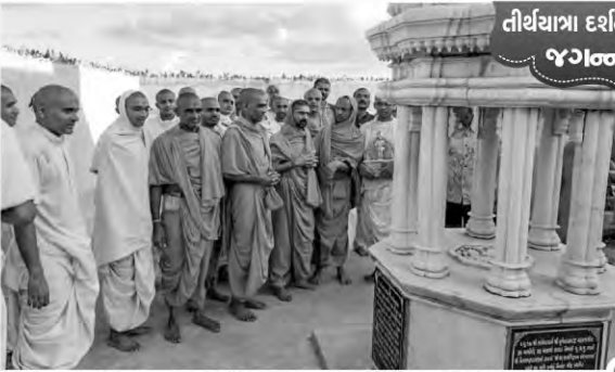
તીર્થયાત્રા દર્શન-બગસરા સંઘ જગન્નાથપુરી