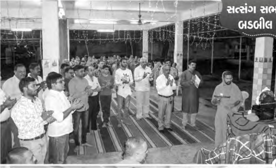
સત્સંગ સભા-પદરામણી બડબીલ (ઓડિશા)