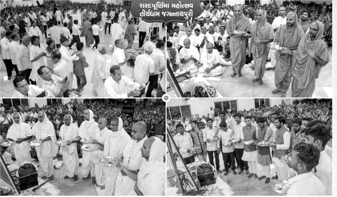
શરદપૂર્ણિમા મહોત્સવ તીર્થધામ જગન્નાથપુરી