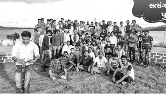
સત્સંગ શિબિર પુના