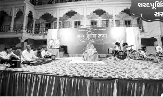
શરદપૂર્ણિમા મહોત્સવ સરધાર