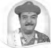
પ.પૂ. ધ.ધુ. ૧૦૦૮ આચાર્ય શ્રી અજેન્દ્રપ્રસાદજી મહારાજ