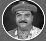
P.P.D. 1008 Shree Acharya Shree Ajendraprasadji Maharaj