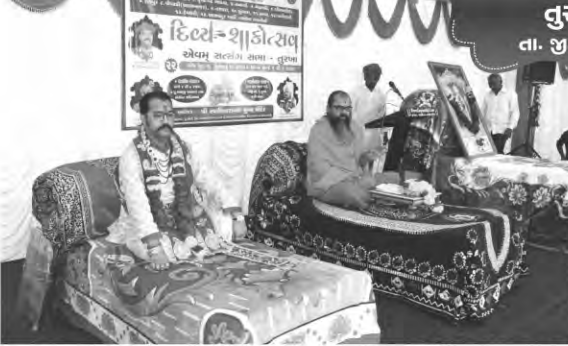
તુરખા તા. જી. બોટાદ