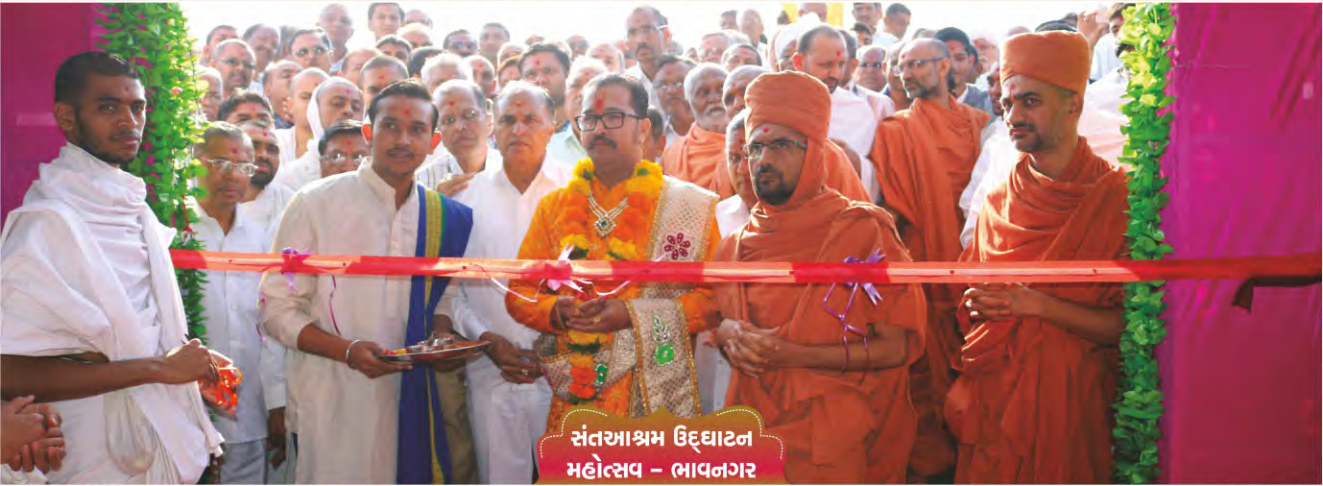
સંતઆશ્રમ ઉદ્ઘાટન મહોત્સવ - ભાવનગર