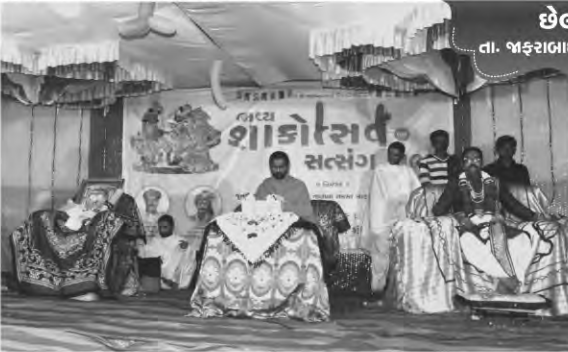
છેલણા તા. જાડરાબાદ, જી. અમરેલી