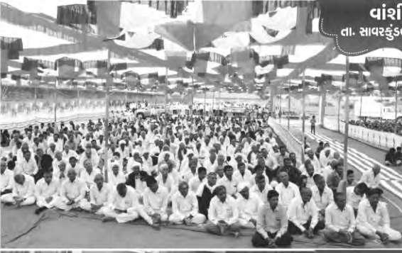
વાંશીયાળી તા. સાવરકુંડલા, જી. અમરેલી