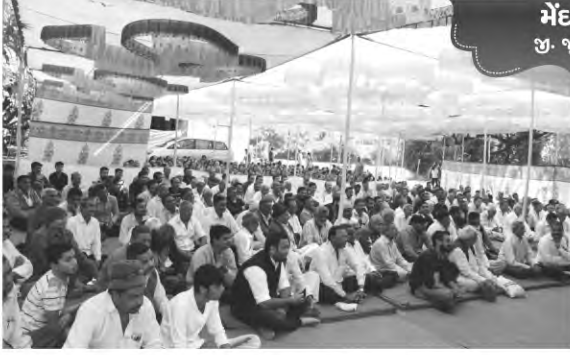
મેંદરડા જી. જૂનાગઢ