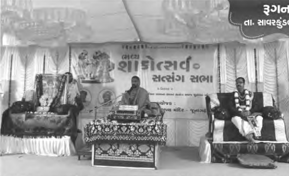
રૂગનાથપુર તા. સાવરકુંડલા, જી. અમરેલી