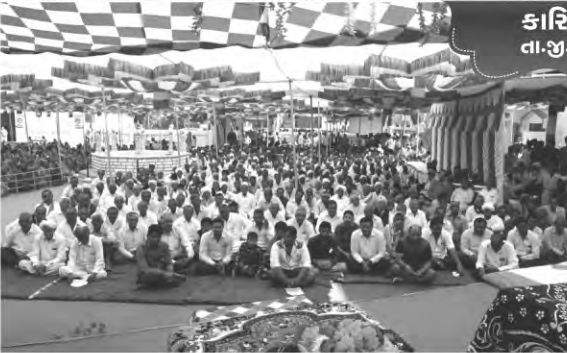
કારિયાણી તા.જી. બોટાદ