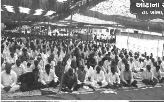
ઓટાના સમટીયાળા તા. ખાંભા, જી. અમરેલી