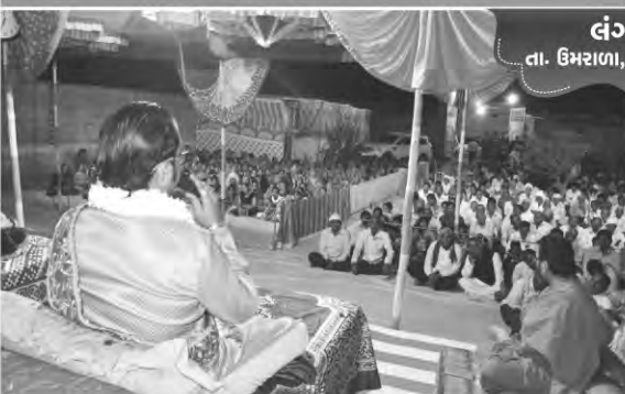
લંગાળા તા. ઉમરાળા, જી. ભાવનગર