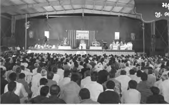
મહુવા જી. ભાવનગર