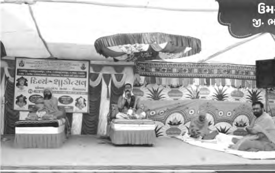
ઉમરાળા જી. ભાવનગર