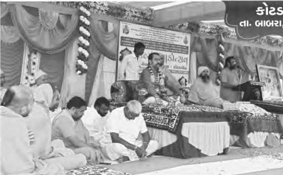
કોટડા પીઠા તા. ભાભરા, જી. અમરેલી