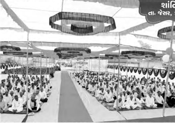
શાંતિનગર તા. જેસર, જી. ભાવનગર