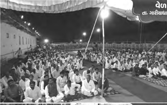
वेलावडर ता. गारीबाधर, ज. भावलगर