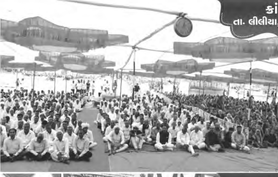
કાંકચ તા. લીલીયા, જી. અમરેલી