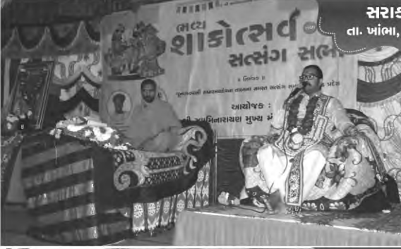
સરાકડીયા તા. પાંભા, જી. અમરેલી