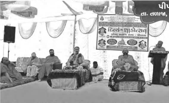
પીપરલા તા. તળાજા, જી. ભાવનગર