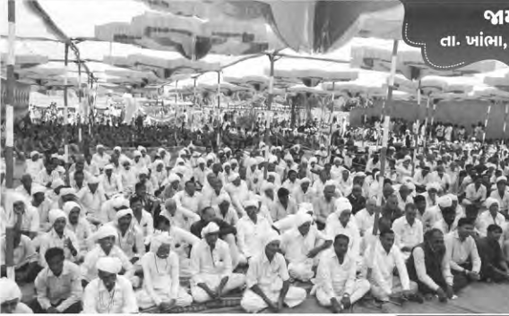
જામકા તા. પાંભા, જી. અમરેલી