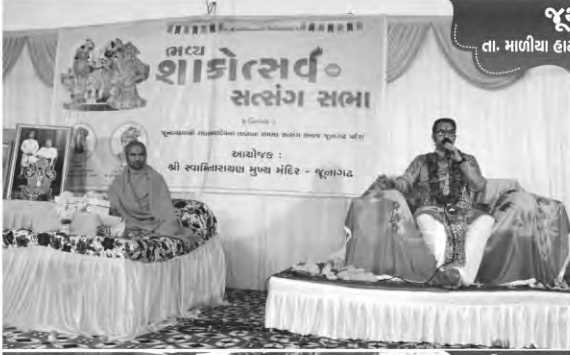
જૂથળ તા. માળીયા હાટીના, જી. જૂનાગઢ