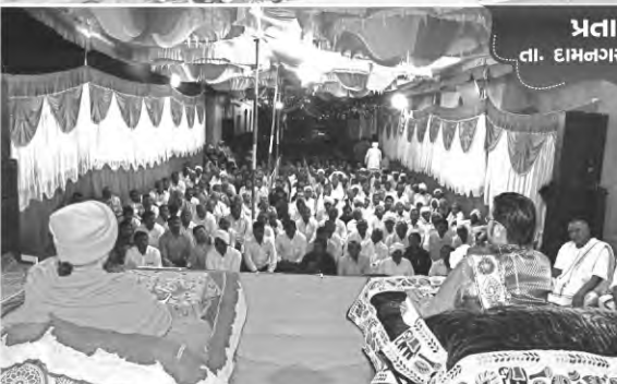
પ્રતાપગઢ તા. દામનગર, જી. અમરેલી