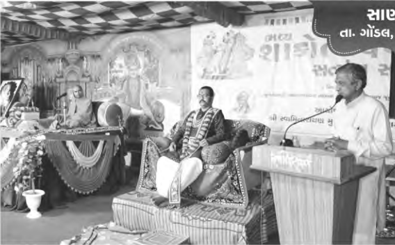
સાઘયલી તા. ગોંડલ, જી. રાજકોટ