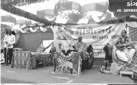
સિંગાવદર તા. ડગસરા, જી. અમરેલી