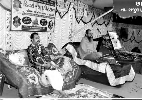
છાપરી તા. રાજુલા, જી. અમરેલી