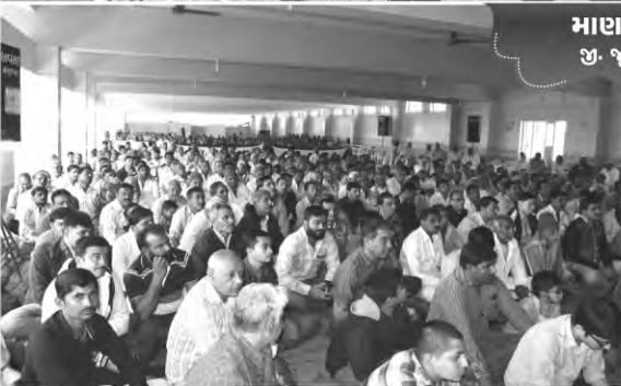
માણાવદર જી. જૂનાગઢ