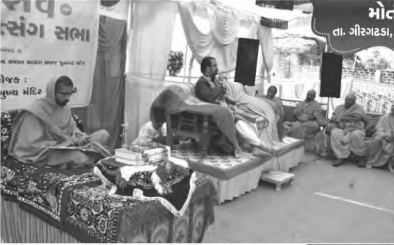
મોતીસર તા. ગીરગઢડા, જી. ગીરસોમનાથ