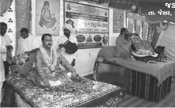
જડકલા તા. જેસર, જી. ભાવનગર