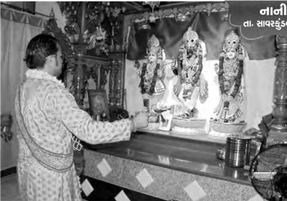
નાની વડાળ તા. સાવરકુંડલા, જી. અમરેલી