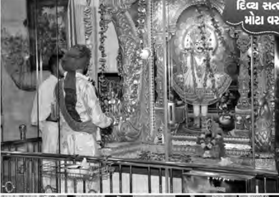
દિવ્ય સત્સંગ શિબિર મોટા વરાછા-સુરત