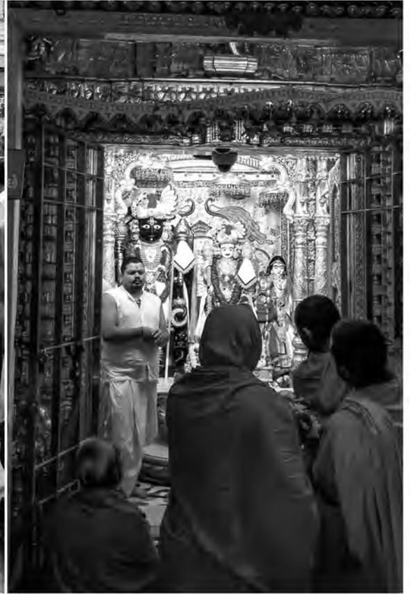
प.पू. ध.धु. आचार्य महाराजश्री तथा प.पू. लावळ महाराजश्रीना ३५ आशीर्वादथी श्री स्वामिनारायण मंदिर-मोटा वराण आयोजित पू. स.गु. स्वामी श्री लक्ष्मीप्रसाददासजना मार्गदर्शन प्रमाणे संतो-छरिलक्तोना सधवारें योजायेल सुरतथी वडताल पदयात्रा