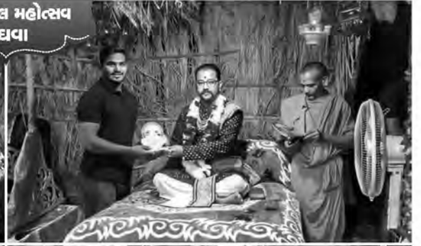
जन मंगल महोत्सव मेघवा