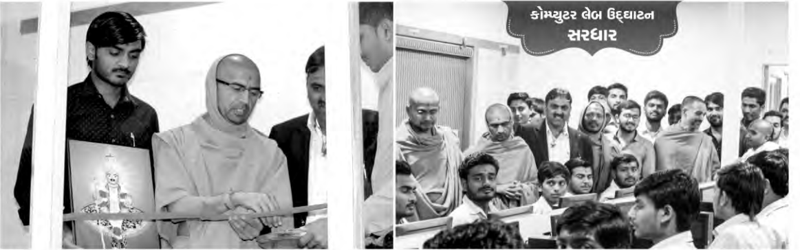
કોમ્પ્યુટર લેબ ઉદ્ઘાટન સરધાર