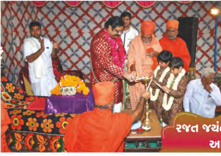
રજત જયંતી મહોત્સવ આણંદ