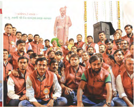
દ્વિમાસિક સત્સંગ સભા ખારઘર-મુંબઈ