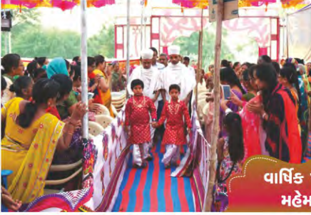
વાર્ષિક પાટોત્સવ મહેમદાવાદ