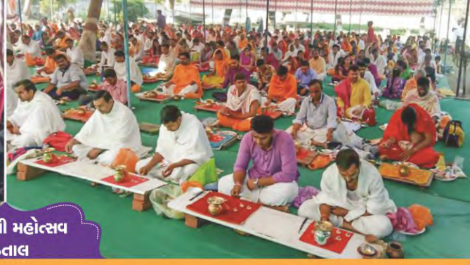
હરિજયંતી મહોત્સવ વડતાલ

શ્રી રઘુવીરવાડી-વડતાલ ખાતે સમગ્ર ધર્મકુળ પરિવારના સાન્નિધ્યમાં ઉજવાયેલ હરિજયંતી પ્રસંગે સમૂહ મહાપૂજા તથા શ્રીહરિ પ્રાગટ્યોત્સવ.