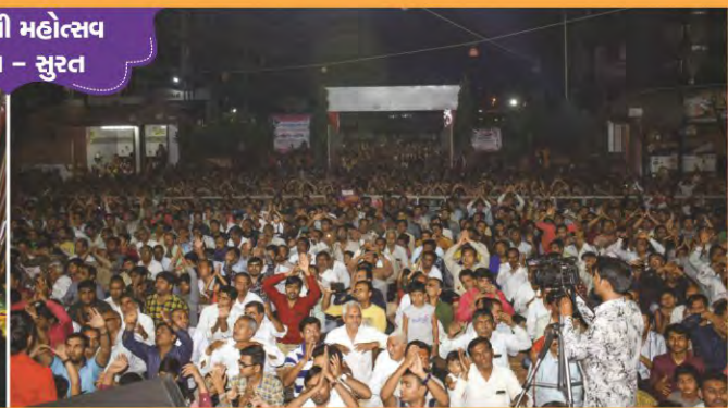
હરિજયંતી મહોત્સવ સીમાડા - સુરત

યોગીચોક-સુરતને આંગણે પ.પૂ. આચાર્ય મહારાજશ્રીની આજ્ઞાથી ઉજવાયેલ શ્રીહરિ પ્રાગટ્યોત્સવ તથા સત્સંગ સભા.