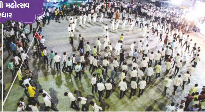
હરિજયંતી મહોત્સવ સરઘાર