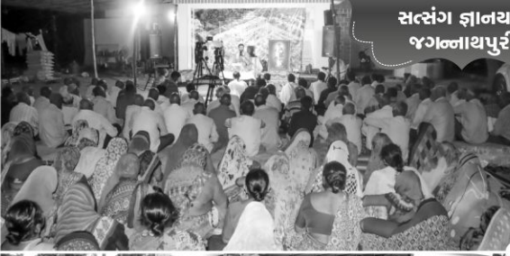
સત્સંગ જ્ઞાનયજ્ઞ જગન્નાથપુરી