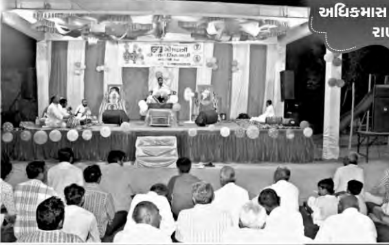
અધિકમાસ કથાપારાયણ રાણપુર