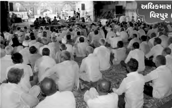
અધિક્માસ કથાપારાયણ વિરપુર (જલારામ)