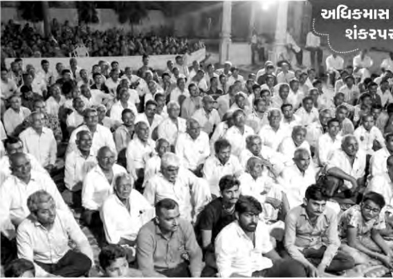
અધિકમાસ કથાપારાયણ શંકરપરા-બોટાદ