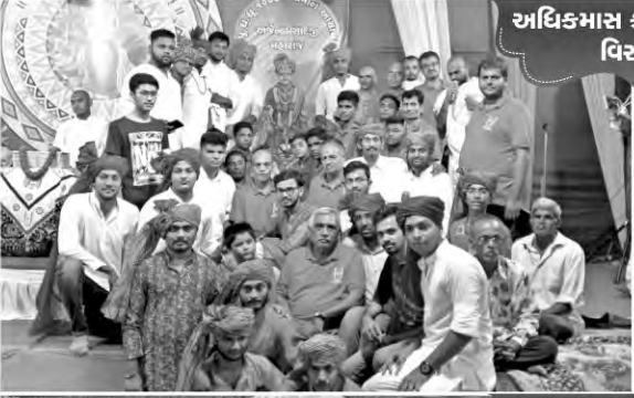
અધિકમાસ કથાપારાયણ વિરસદ