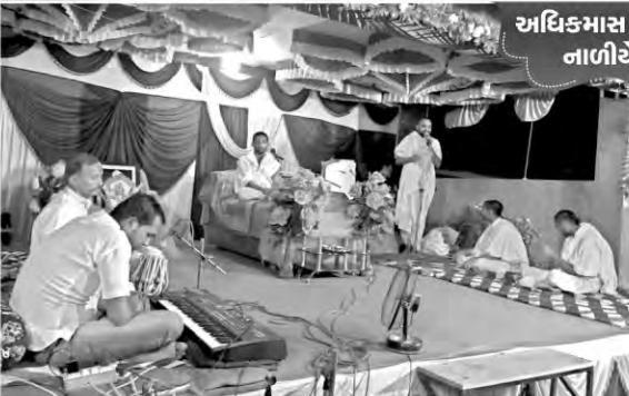
અધિકમાસ કથાપારાયણ નાળીયેલી મોલી