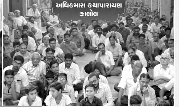
અધિક્માસ કથાપારાયણ કાલોલ