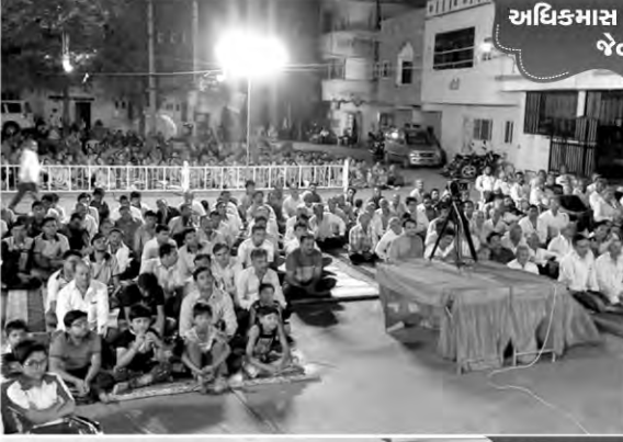
અધિકમાસ કથાપારાયણ જેતપુર