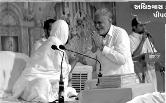
અધિકમાસ કથાપારાયણ પીપળલગ