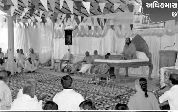
અધિક્માસ કથાપારાયણ છપૈયા