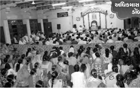
અધિક્માસ કથાપારાયણ ડોંબીવલી