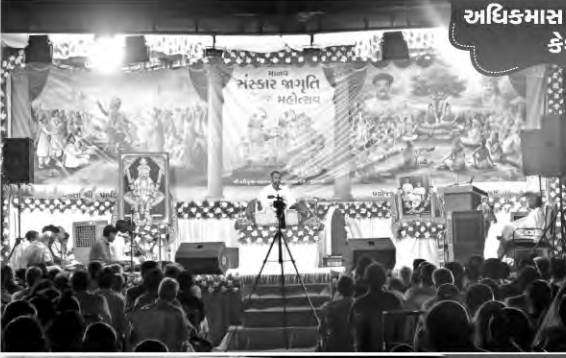
અધિકમાસ કથાપારાયણ કેશોદ