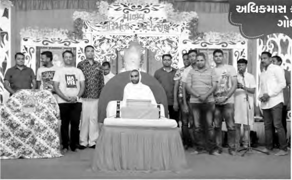
અધિકમાસ કથાપારાયણ ગોધરા