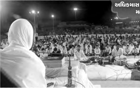
અધિકમાસ કથાપારાયણ મહુવા