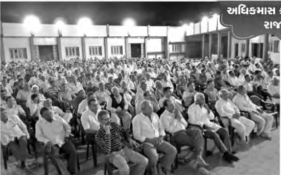
અધિકમાસ કથાપારાયણ રાજકોટ