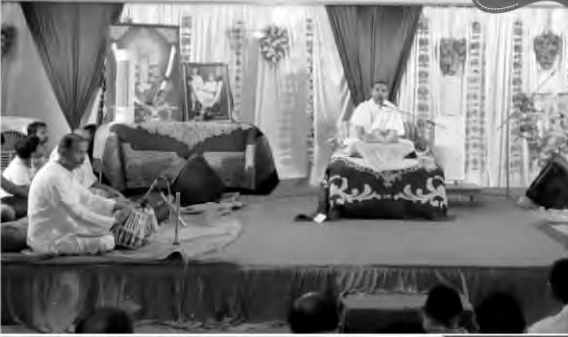
અધિકમાસ કથાપારાયણ માણાવદર