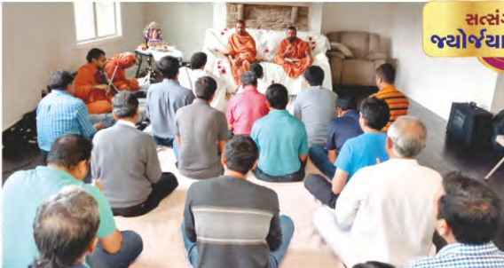
સત્સંગ સભા જયોજ્યા-અમેરિકા