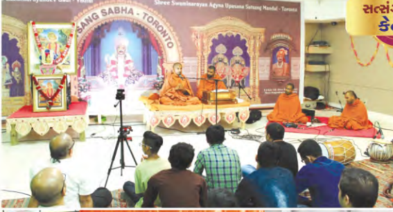
સત્સંગ સભા કેનેડા