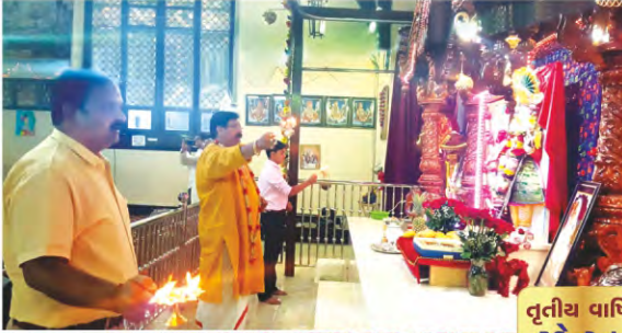
તૃતીય વાર્ષિક પાટોત્સવ સ્કેન્ટન-અમેરિકા

રાંદેર-સુરતને આંગણે પ.પૂ. આચાર્ય મહારાજશ્રીના આશીર્વાદથી મંદિરના વાર્ષિક પાટોત્સવ પ્રસંગે પ.પૂ.નાનાલાલજી મહારાજશ્રીની ઉપસ્થિતિમાં યોજાયેલ કથાપારાયણ.