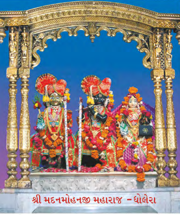
શ્રી મદનમોહનજી મહારાજ - ધોલેરા