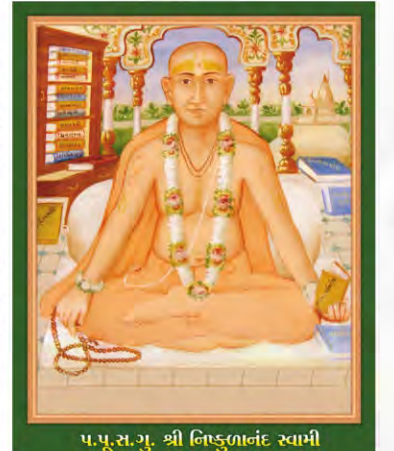
પ.પૂ.સ.ગુ. શ્રી નિષ્કુળાનંદ સ્વામી

નિષ્કુળાનંદ સ્વામીના હાથમાં ટાંકણો હોય તો પથ્થર બોલતો થઈ જાય, રંધો હોય તો લાકડામાં ડિઝાઈન પડી જાય અને કલમ હોય તો કાવ્યો-કીર્તનો રચાઈ જાય.