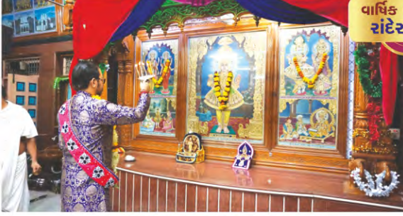
વાર્ષિક પાટોત્સવ રાંદેર-સુરત