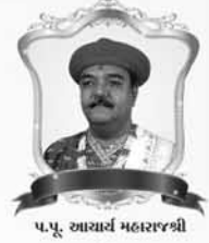
પ.પૂ. આચાર્ય મહારાજશ્રી

આયોજક :- શ્રી સ્વામિનારાયણ બાગ, શ્રી સ્વામિનારાયણ મંદિર - સરધાર, તા.જી. રાજકોટ મો. ૭૬૦૦૦ ૫૮૫૦૩, ૯૪૦૯૪ ૯૦૮૯૦