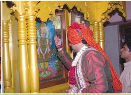
મહિલા મંદિરમાં પ્રતિષ્ઠાવિધિ