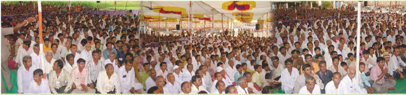
મહોત્સવનો નિત્ય લાભ લેતા સોરઠ પ્રદેશના તેમજ ચણાકા વિસ્તારના ભક્તજનો

પ.પૂ.સનાતન ધ.ધુ. ૧૦૦૮ શ્રી ધર્મમાર્તંડ, ધર્મકુળ યુગમણી આચાર્ય શ્રી અજેન્દ્રપ્રસાદજી મહારાજશ્રીના 'ગાદિ પટ્ટાભિષેક' ના 'રજત જયંતિ વર્ષ'માં ચણાકા (ચવન ઋષિનું) ને આંગણે યોજાયેલ શ્રી સ્વામિનારાયણ મંદિરનો ભવ્ય 'મૂર્તિ પ્રતિષ્ઠા મહોત્સવ' (તા. ૨૬ નવેમ્બર થી ૫ ડીસેમ્બર - ૨૦૦૮) શ્રી સ્વામિનારાયણ ચિંતન, ન્ડીસેમ્બર - ૨૦૦૮ (૩૬) Printed and Published by Swami Viraktsrupdasji on behalf of Shree Swaminarayan Temple - Sardhar and Printed at Sahajanand Press, 80 Feet Road, Rajkot. and Published from Shree Swaminarayan Temple - Sardhar, Dist-Rajkot - 360025. Editor - Sadhu Divyaswarupdas