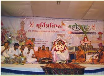
રાત્રિના કીર્તન-ભક્તિ કાર્યક્રમ