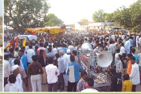
ઠાકોરજીની નગરયાત્રા તથા ભવ્ય શોભાયાત્રા