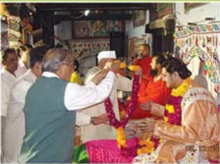
કચાપારાયણ - ગઢપુર