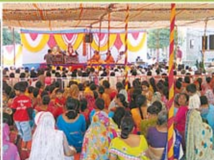
મકતજનોને રૂડા આશીર્વાદ - પારડી(રાજકોટ)