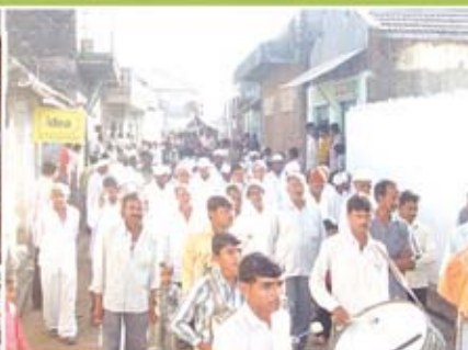
શાકોત્સવ પ્રસંગે શોભાયાત્રા - તોરી