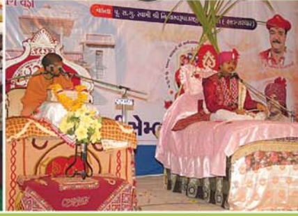
અંતરના રૂડા અમૃતમય આશીર્વાદ