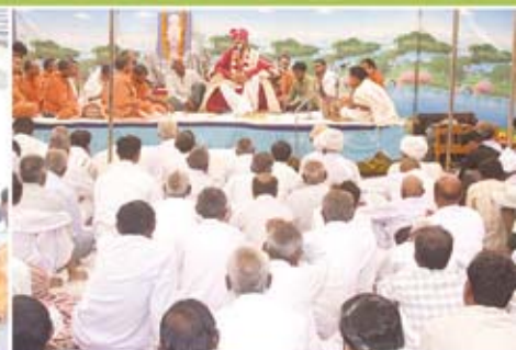
મકતજનોને રૂડા આશીર્વાદ - તોરી