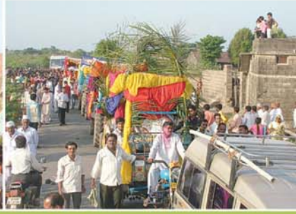
ઠાકોરજીની નગરયાત્રા તથા ભવ્ય શોભાયાત્રા