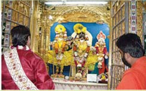
શ્રી ગોપીનાથજી મહારાજના દર્શને - ગઢપુર