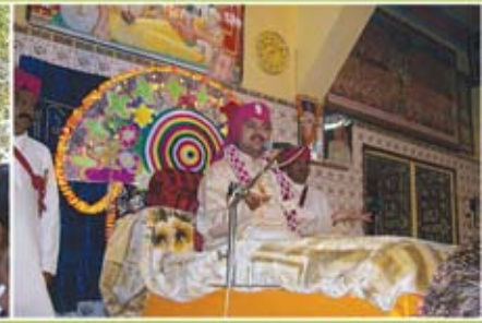
રજમો વાર્ષિક પાટોત્સવ - જામવંચલી