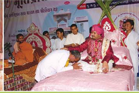
મંદિરમાં નિઃસ્વાર્થ સેવા કરનારને આશીર્વાદ