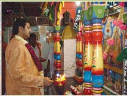
સત્સંગ સભા - લંગાળા