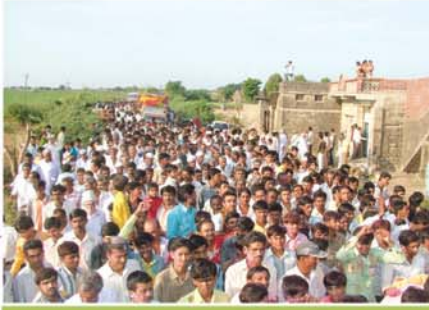
ઠાકોરજીની નગરયાત્રા તથા ભવ્ય શોભાયાત્રા