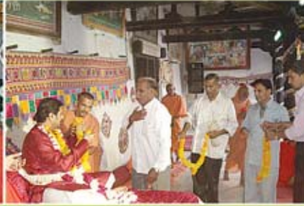
કથાપારાયણ - ગઢપુર