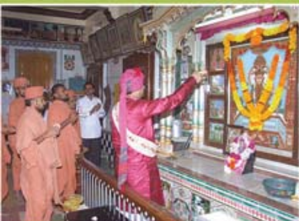
શ્રી સ્વા. મંદિર - તોરી (રામપર)