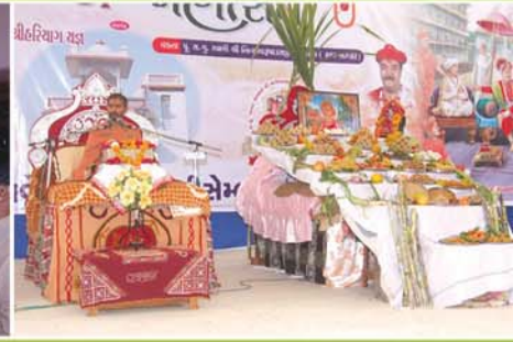
કથા અંતર્ગત અજ્ઞકૂટોત્સવ