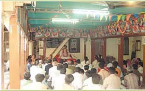
સત્સંગ સભા - ડભોઈ