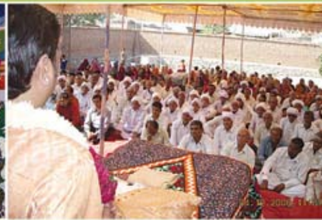
સત્સંગ સભા - લંગાળા