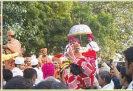
રજમો વાર્ષિક પાટોત્સવ - જામવંચલી