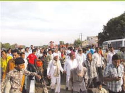
સ્વાગત શોભાયાત્રા - પારડી(રાજકોટ)