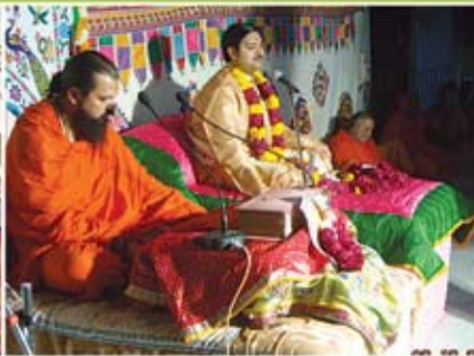
કચાપારાયણ - ગઢપુર