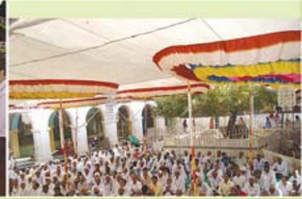
દરબારગઢમાં કલા શ્રવણ કરતા ભક્તજનો