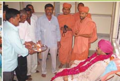
યજમાનશ્રી દ્વારા આરતી - પારડી(રાજકોટ)