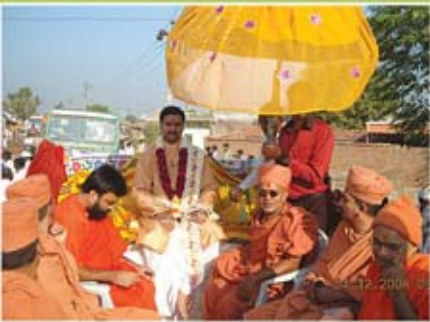
સત્સંગ સભા - લંગાળા