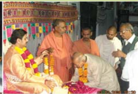
કચાપારાયણ - ગઢપુર