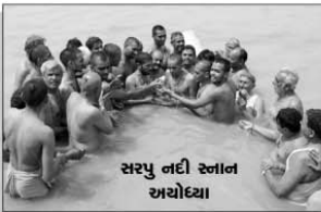
સરયુ નદી સ્નાન અયોધ્યા