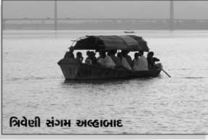
ત્રિવેણી સંગમ અલ્હાબાદ