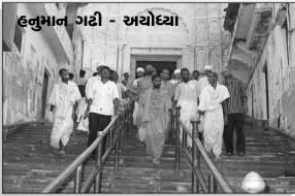
હનુમાન ગઢી - અયોધ્યા