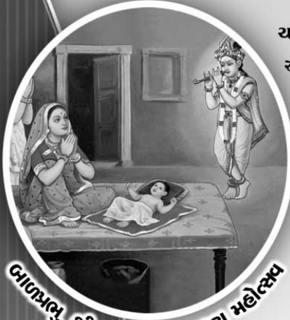
બાળપ્રભુ શ્રી ધનશ્યામપ્રાગટ્ય મહોત્સવ