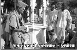
રામાનંદસ્વામી જન્મસ્થાન - અયોધ્યા