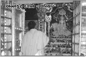
અન્નકુંડ દર્શન - છપૈયા