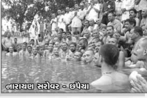
નારાયણ સરોવર - છપૈયા