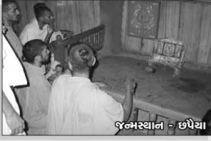
જન્મસ્થાન - છપૈયા