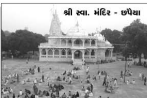
શ્રી સ્વા. મંદિર - છપૈયા