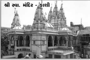
શ્રી સ્વા. મંદિર - કાશી