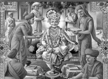
વચનામૃત લેખનકાર્ય સમાપ્ત