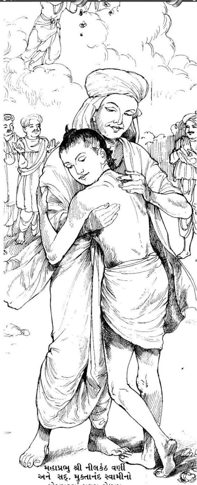
મહાપ્રભુ શ્રી નીલકંઠ વર્ણી અને સદ્. મુક્તાનંદ સ્વામીનો લોજપુરમાં પ્રથમ મેળાપ

પણ તમારી સાથે અત્યારે જ તેઓના દર્શન માટે આવું છું.”