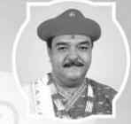
P.P.D. 1008 Shree Acharya Shree Ajendraprasadji Maharaj