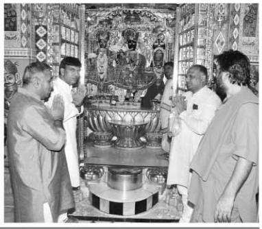
ગઢડાને આંગણે શ્રી ગોપીનાથજી મહારાજના દર્શનાર્થે પધારતા ગુજરાત રાજ્યના માન. મુખ્યમંત્રી શ્રીમતિ આનંદીબેન પટેલ તથા અન્ય મંત્રીશ્રીઓ.