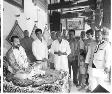
ગઢપુરધામને આંગણે સિદ્ધપુરા પરિવાર (મુંબઈ)ના યજમાપદે યોજાયેલ કથાપારાયણમાં પધારતા પ.પૂ. નાનાલાલજી મહારાજશ્રી.