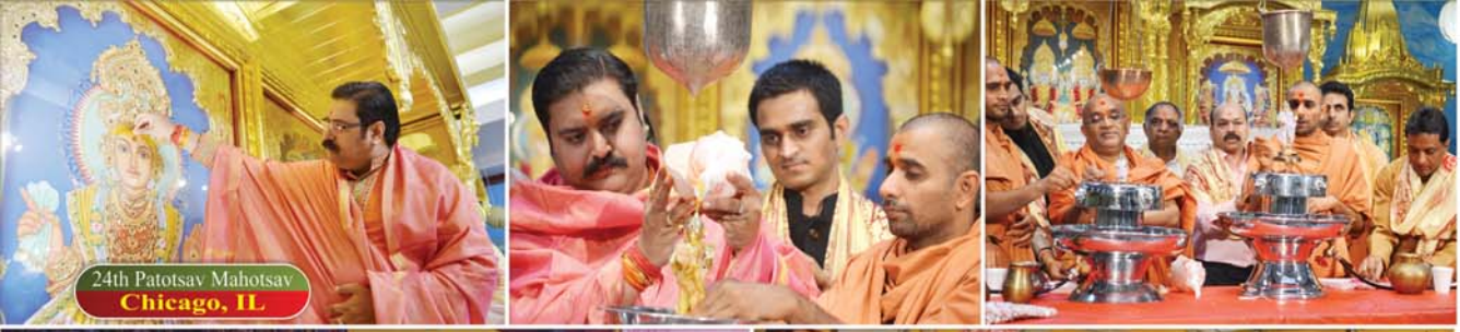
24th Patotsav Mahotsav Chicago, IL