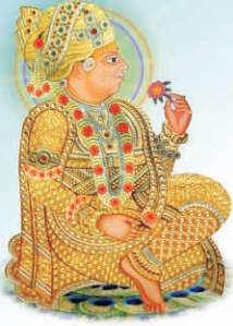
સર્વાવતારી ભગવાન શ્રી સ્વામિનારાયણ