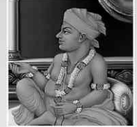
સ.ગુ. શ્રી ગુણાતીતાનંદ સ્વામી