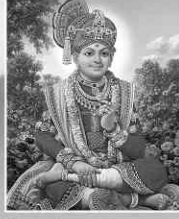
શ્રી સ્વામિનારાયણ ભગવાન

E-mail : chintansardhar@yahoo.in sardharmandir@gmail.com