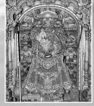
શ્રી કષ્ટભંજન દેવ મહારાજ