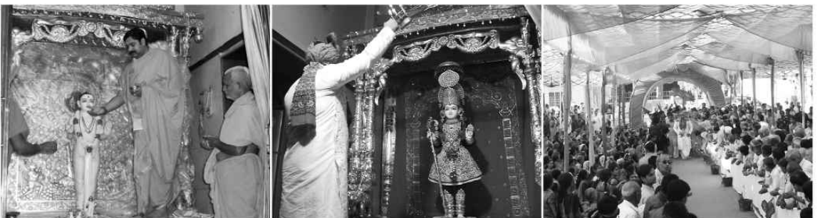
ઉમરેઠને આંગણે પ.પૂ. ધ.ધુ. આચાર્ય મહારાજશ્રીના રૂડા આશીર્વાદથી ઉજવાયેલ શ્રી ઘનશ્યામ મહારાજ આદિક ટેવોનો વાર્ષિક પાટોત્સવ (તા. ૨૯-૩-૨૦૧૧)