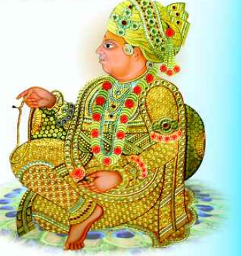
सर्वावतारी भगवान श्री स्वामिनारायण

श्री स्वामिनारायण महोत्सव श्रीमद् सत्संगिजुवन कथा पारायण