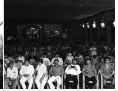
पुना शहरने आंगणे प.पू. ध.धु. आचार्य महाराजश्रीना ३३ आशीर्वादथी प.पू. लावण महाराजश्रीना दिव्य सांनिध्यमां योज्जयेल हिव्य सत्संग सभा (ता. २-४-२०११)