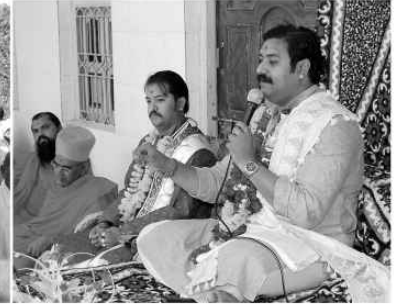
नारीवेली मोली (जूनागढ प्रदेश) गामने आंगणे प.पू. लावण महाराजश्रीना दिव्य सांनिध्यमां योज्जयेल हिव्य सत्संग सभा (ता. ५-४-२०११)