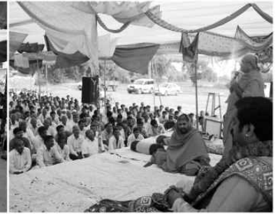
हेजरावाड गामने आंगणे प.पू. लावण महाराजश्रीना दिव्य सांनिध्यमां उजवायो हरिभदिरमां विराजमान देवोनी वार्षिक पाटोत्सव (ता. ८-४-२०११)