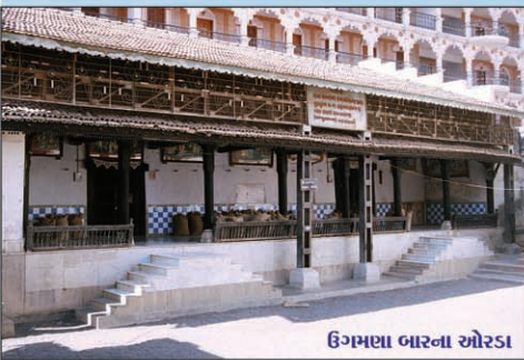
ઉગમણા બારના ઓરડા