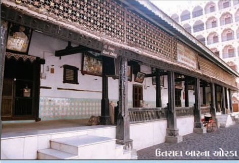
ઉતરાદા બારના ઓરડા