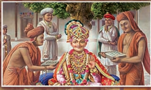
વચનામૃતની ૧૮૬મી જયંતીએ કોટિ કોટિ વંદના...

સંપ્રદાયનો સર્વાંગી વિકાસ કરતું શ્રી સ્વા. મંદિર - સરધારનું મુખપત્ર