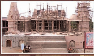
સરધારમાં શ્રીજી મહારાજના સંકલ્પ મુર્તિસમા નવ નિર્માણ પામતું શ્રી સ્વામિનારાયણ મંદિર