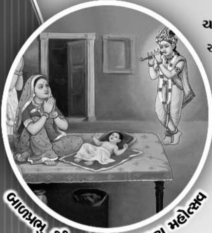
બાળપ્રભુ શ્રી ઘનશ્યામપ્રાગટ્ય મહોત્સવ