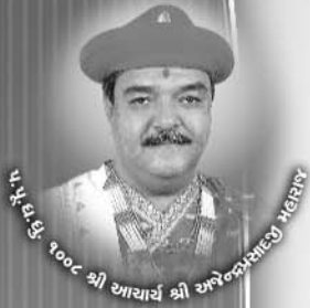
પ.પૂ. ધ.પુ. ૧૦૦૮ શ્રી આચાર્ય શ્રી અજેન્દ્રપ્રસાદજી મહારાજ