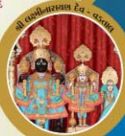
શ્રી લક્ષ્મીનારાયણ દેવ - વડતાલ