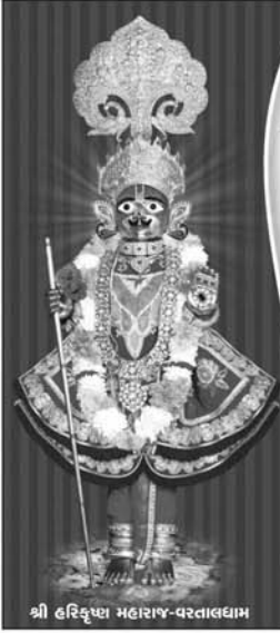
શ્રી હરિકૃષ્ણ મહારાજ-વડતાલધામ